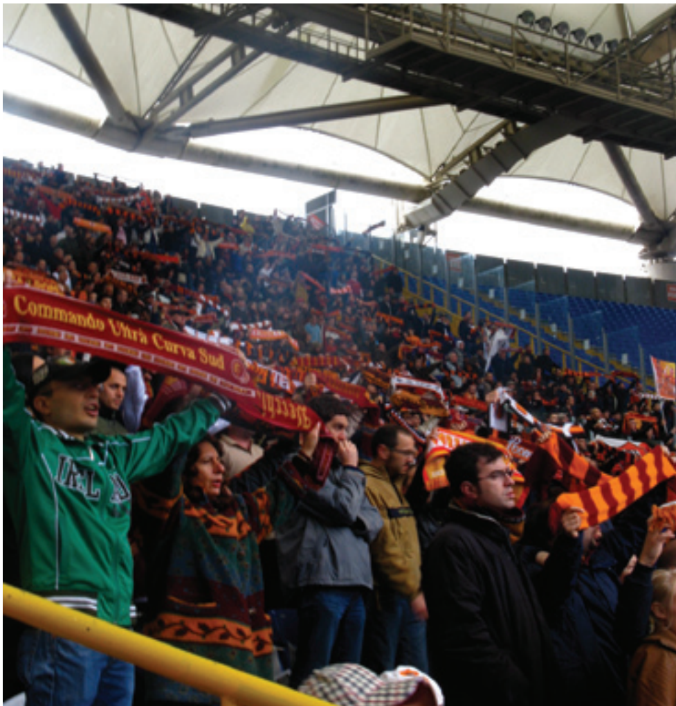
Jotta pääsi jalkapallostadionille, piti läpäistä tiukat turvatarkastukset. Jokaisella oli omalla nimellä varustettu pääsylippu. Jalkapallo-ottelussa oli jännä seurata, miten italialaiset fanit kannustivat.

Poistun stadionilta ja mietin; jalkapallo Italiassa – ei tosiaanakaan "vain" jalkapalloa.