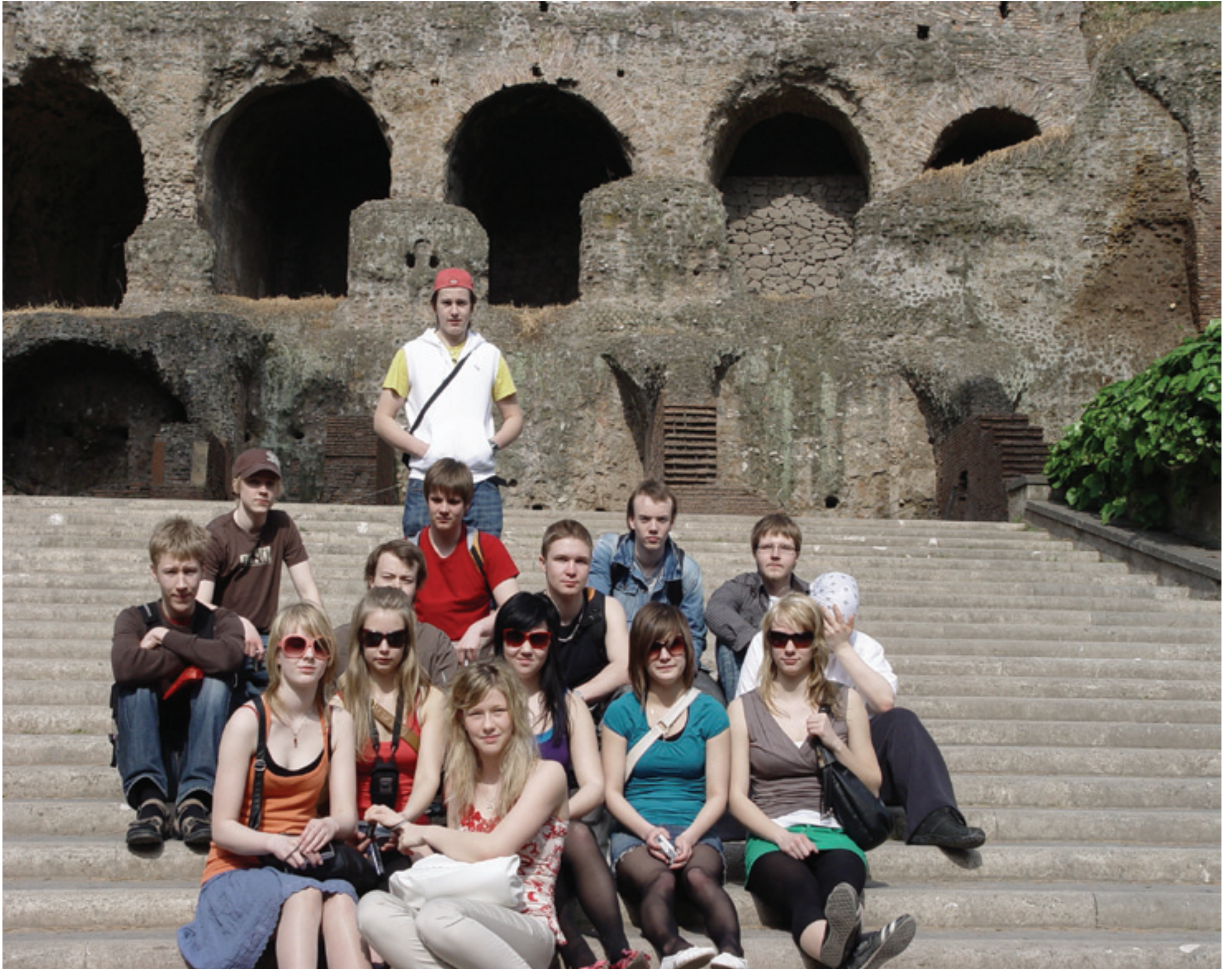
Forum Romanumin pylväiden, pylväskäytävien ja kaariholvien keskellä voi kuvitella mielessään suuren keisarillisen kaupungin keskuksen, Euroopan ensimmäisen, jossa oli miljoona asukasta.