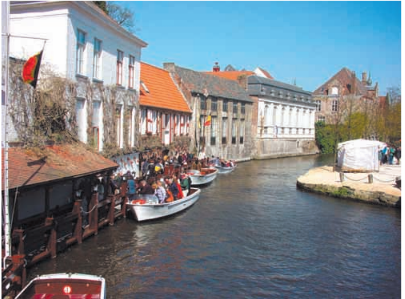
Brugge on Belgian somin kaupunki ja sievimpiä Euroopassa.

Euroopan Komissio nimitti "ehdokkuusvaliokuntaan" 2 jäsentä, Ministerineuvosto 2, Euroopan Parlamentti 2 ja Aluekomitea 1 jäsenen. 7 vaikutusvaltaisen ja puolueettoman jäsenen ehdokkuusvaliokunta toimii yhdessä komission, neuvoston ja parlamentin kanssa, joista viimeinen esittää mielipiteen Ministerineuvostolle, joka ottaa huomioon ehdokkuusvaliokunnan ra-