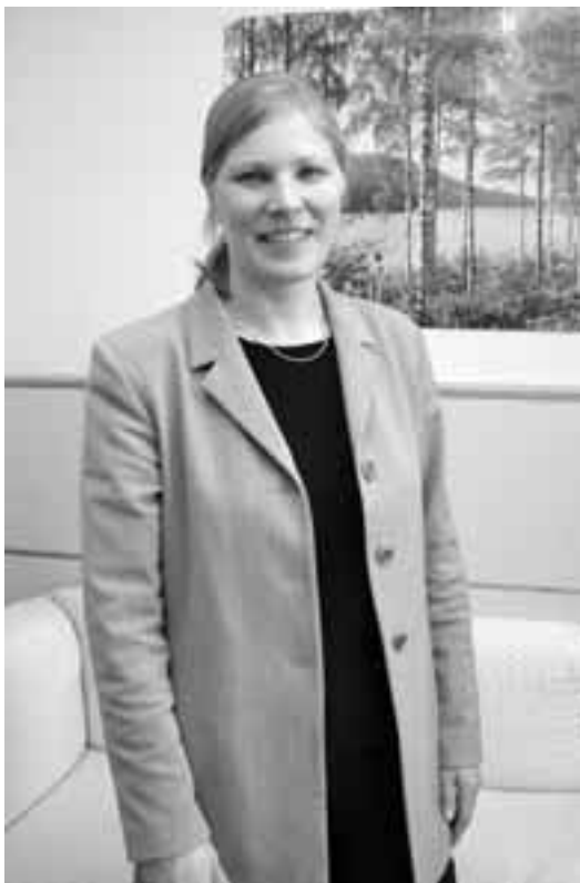
Euroedustaja Marjo Matikainen-Kallström toimii muun muassa teollisuus- ja ulkomaankauppa-, tutkimus- ja energiavaliokunnan jäsenenä.