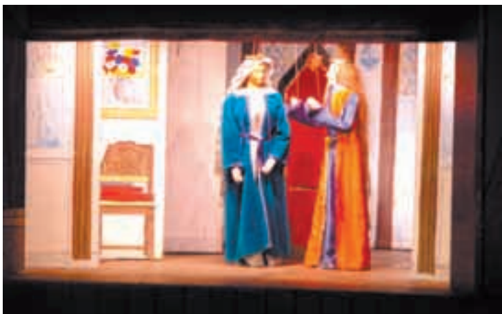
Brysselin erikoishuvitus on samalla kertaa erittäin taidokas ja juurevan kansanomaisen nukketeatteri.

Nukketeatterin esitteissä lupailtiin, ettei tarvitse osata paikallista kieltä nauttiakseen esityksestä, mutta ainakin meitä se häiritsi, ettei ymmärtänyt. "Esitys oli omalaatuinen, vaikka minulla ei juuri olekaan vertailukohteita", Kopisto kuitenkin kertoo. Kielen osaamisesta oli siis paljon hyötyä. Mutta olihan nukketeatteri mielenkiintoinen elämys sinänsä.