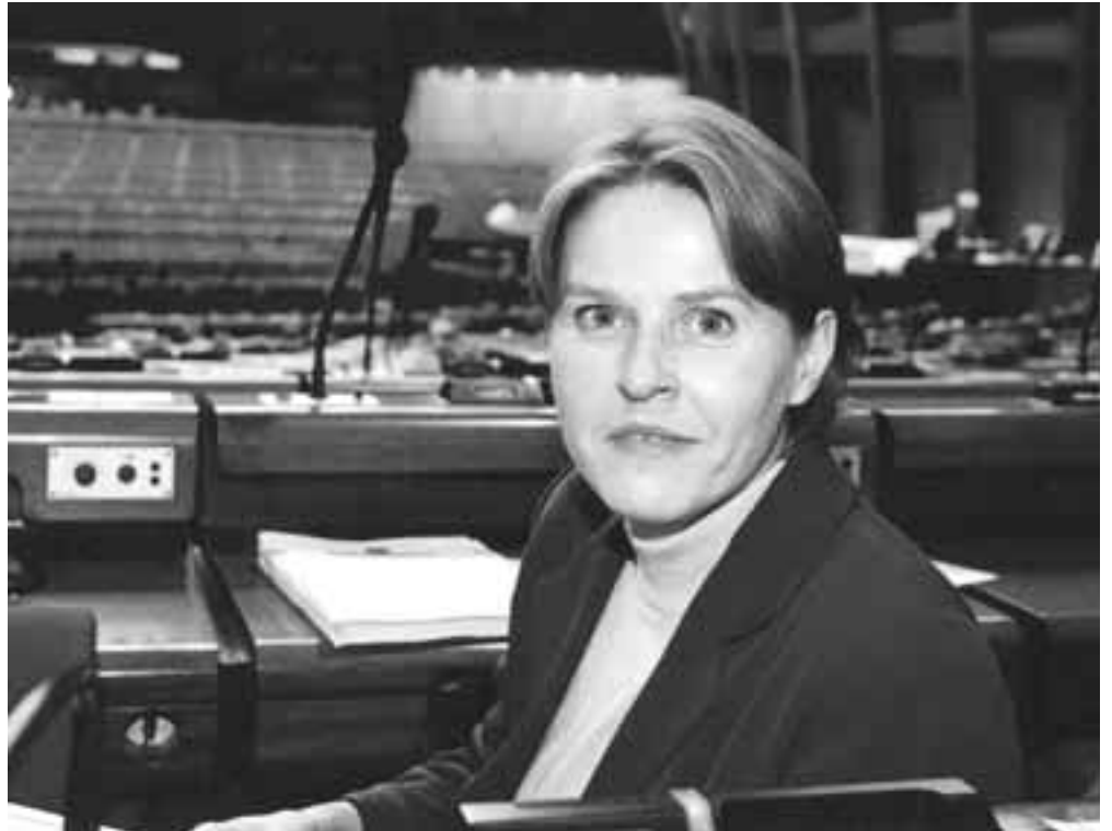
Heidi Hautala on ollut parlamentin vihreän ryhmän jäsen koko Suomen EU-jäsenyyden ajan.

Hautalaa kiinnostaa todella moni asia, mutta aika ja energia eivät riitä joka paikkaan. ”Heikko puoleni on se, että minulla on liian monta rautaa tulella”, hän naurahuttaa. ”Ei ole mahdollisuutta normaaliin perhe-elämään; elämäntapana tämä on aika rasitta-