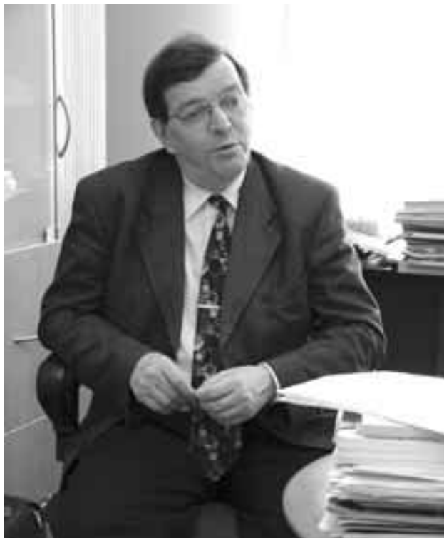
Tapasimme euroedustaja Paavo Väyrysen torstaina 4. huhtikuuta; samana päivänä hän lensi Suomeen ja ilmoittautui Keskustan puheenjohtajaehdokkaaksi.

Rasimus oli suurena apuna myös meille Pyhäjoen opintomatkalaisille, sillä hän järjesti meille isot työskentelytilat parlamentissa olomme ajaksi. Auttaakseen meitä hän joutui tekemään töitä oman alueensa ulkopuolelta, mutta ei välittänyt siitä, koska piti meidän auttamista tärkeänä. Työajat ovat suhteellisen normaali; työpäivä alkaa aamulla ennen yhdeksää ja loppuu illalla kuuden maissa. Työaikana hän täyttelee lomakkeita, korjaa ja valvoo koneiden toimintaa. Tavallisiakin työntekijöitä siis tarvitaan, jotta toiminta parlamentissa pyörisi tehokkaasti. Monella voi olla mielikuva, että parlamentissa on vain poliitikkoja tai parlamentaarikkoja.