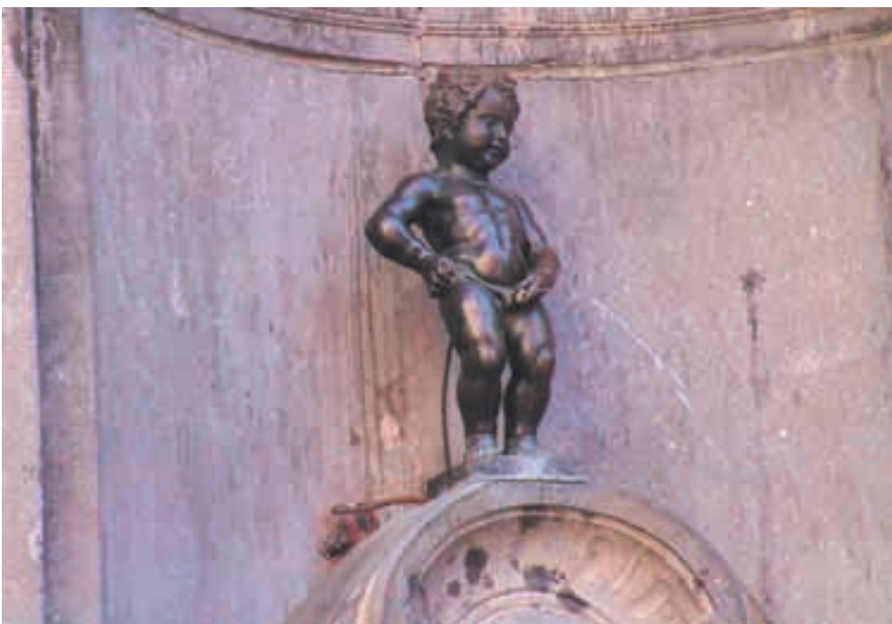
Manneken-Pis -patsas valaa katsojaansa oikeanlaista huumorimieltä ennen tutustumista kaupungin vakavahenkisempiin kulttuurikohteisiin.