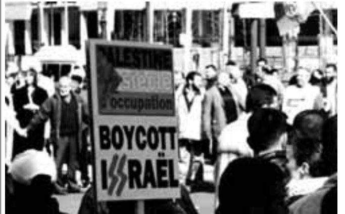
Brysselissä järjestetyssä mielenosoituksessa 25000 ihmistä vastusti Israelin toimia.

peeksi taistella oman valtion saamiseksi. Jos isommat voimat, kuten USA tai EU-parlamentti sanoisivat Sharonille, että tämä antaisi Palestiinalle oman valtion Israelista, Sharon ehkä lopettaisi. Siispä mielenosoitukset ovat ehkä ainoa keino. Melkein kaikkea muuta onkin jo kehitetty, kuten itsemurha iskuja palestiinalaisten alueilta Israeliin. Mielenosoituksen ensimmäiset tulokset tulivat pian Brysselin mielenosoituksen jälkeen, sillä Bryssel vaati Israelia lopettamaan panssarivaunujen ja helikopterien käytön. Mielenosoittajien joukosta eräät naiset kertoivat haluavansa vain rauhaa juutalaisten, muslimien ja kristittyjen välille. Siis mielenosoitus oli rauhallinen, ja siitä kertoi jo sekin, että seassa oli paljon lapsia. Palestiina yrittää nyt siis itsenäistää Israelista rauhan merkeissä. Ehkäpä he vielä saavat itsenäisyytensä.