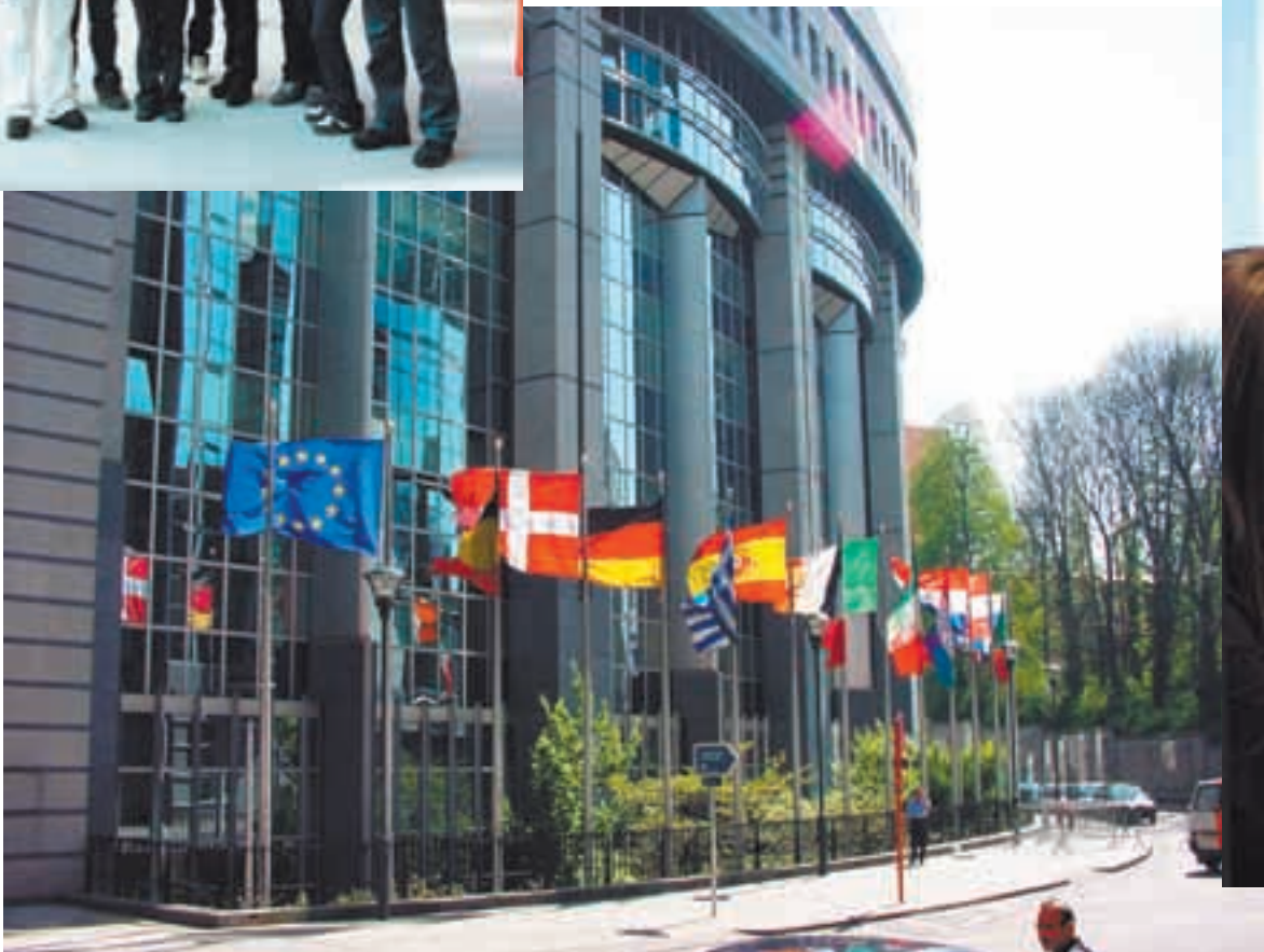
Euroopan parlamentin, maailman toiseksi suurimman rakennuksen sisään - lattiapinta-alaa rakennuksessa on vajaat 400 000 m 2 - mahtuu tuhansien ihmisten työtilojen lisäksi kahviloita, ravintoloita, kampaamoja, kauppoja, kymmeniä kokoustiloja sekä 626 -jäsenisen parlamentin täysistuntosali.