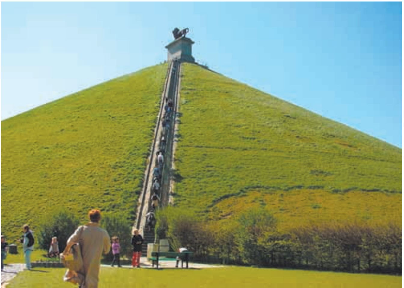
Oranian prinssille pystytetyn muistomerkin ääreltä avautuu näkymä Waterloo taistelutanterille.

Porte de Hal -metroaseman läheltä pääsee bussilla Waterlooohon, tai paremmin sanottuna suunnilleen kilometrin päähän taistelualueesta. Heti bussipyysäkiltä voi nähdä 30 metriä korkean muistomerkin, joka toimii hyvänä suuntaviivana. Muutaman minuutin kävelyn jälkeen huomaat Waterloo-keskuksen,