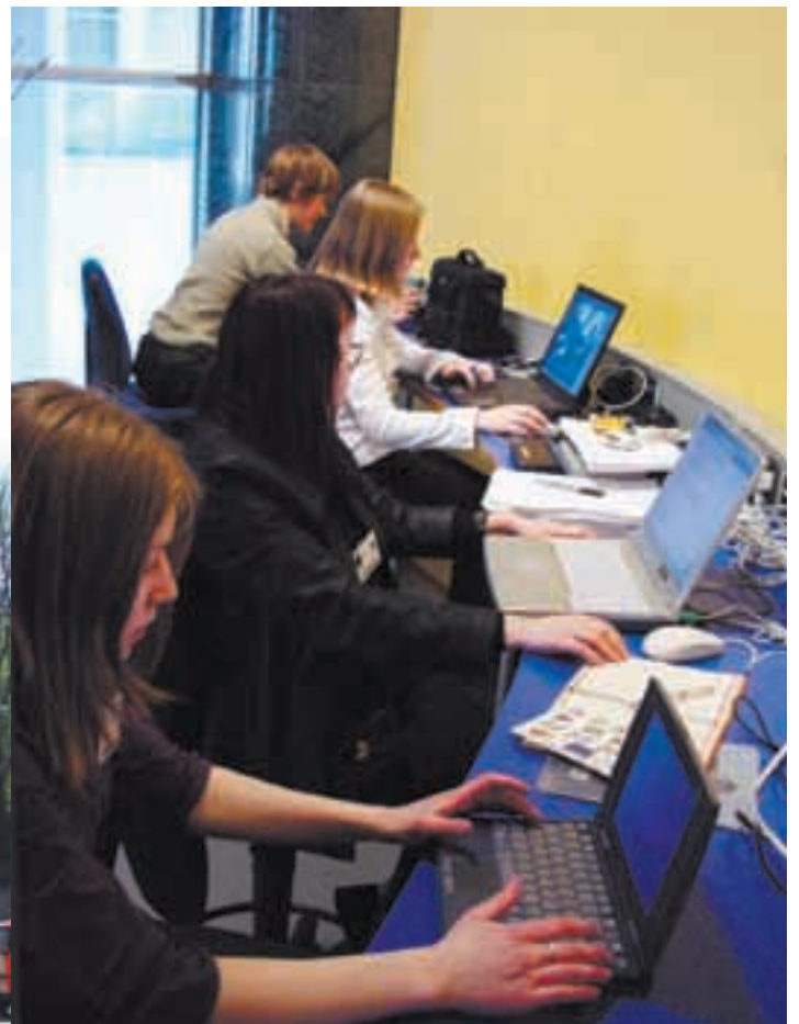
Opiskelija-toimittajien mukana oli kannettavia tietokoneita, video- ja digitaalikameroita. Työskentelypisteinä oli Euroopan parlamentin Infocenter