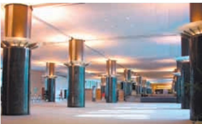
Parlamentissa on paljon lentokentän odotusaulaa muistuttavia tiloja

Brysselin keskustassa upean Léopold-puiston vieressä sijaitseva parlamentti ja sen toimitilat ovat oma maailmansa.