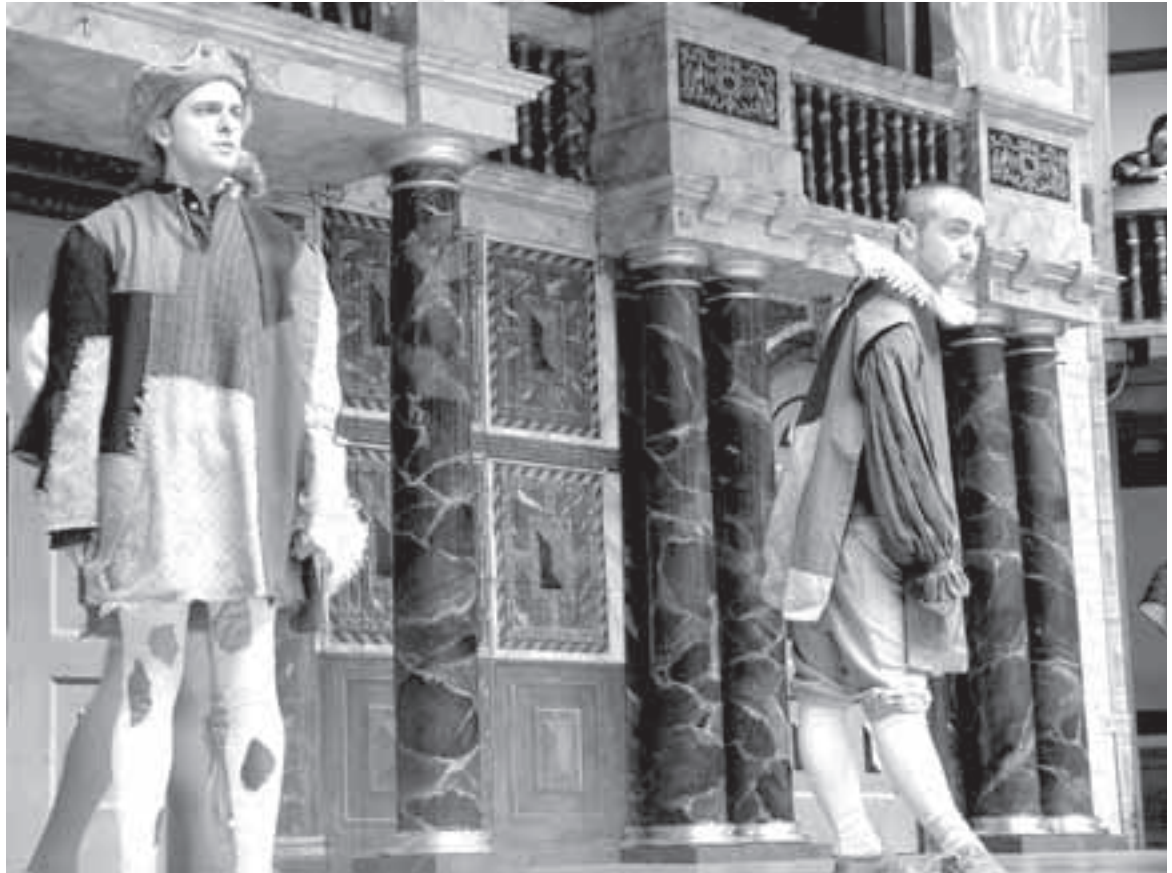
Globe-teatterin näyttelijät esittivät syntymäpäivänä katkelmia Shakespearen näytelmistä.