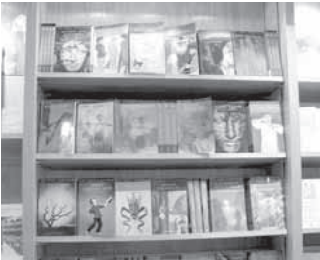
Globen kirjakaupasta voi ostaa kaikkea Shakespearen liittyvää: kirjoja, videoita, sulkakyniä ja suklaata.