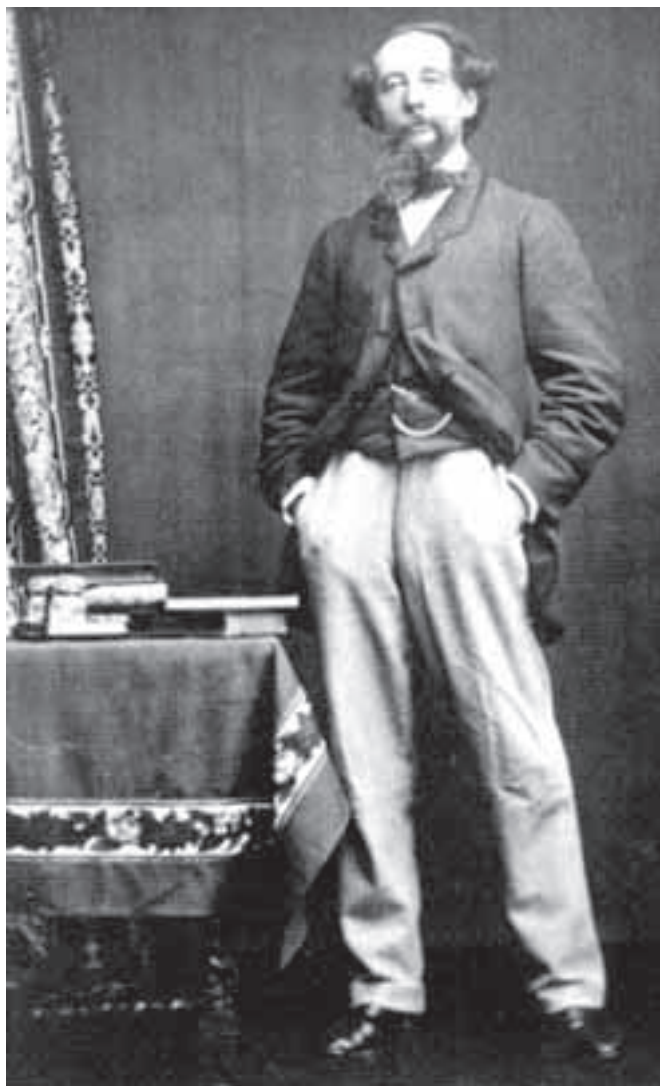
Charles Dickens (1812 - 1870) oli tulieluinen pienten ihmisten puolestapuhuja. Hän tunsikin omakohtaisesti kurjuudessa ja ahdingossa elävän Lontoon. Varsinkin köyhien lasten kohtalo oli lähellä kirjailijan sydäntä. Lapsen sielunelämän kuvaajana Dickens suorastaan hämmästyttää uudenakaisuudellaan.

Elämänsä aikana Dickens ehti saavuttaa suuren suosion. Omaan aikaan eniten myydyimmän kirjailijan kirjoja luetaan vieläkin paljon Englannin kouluissa. Eivätkä tarinat koskaan vanhene. Dickensin ajattomuudesta henkii myös tämä museo, jossa huonekalut on poimittu suoraan 1800-luvulta. Kaikki on lähes täydellistä, jotta museon vierailija voisi elää uudestaan Dickensin elämää.