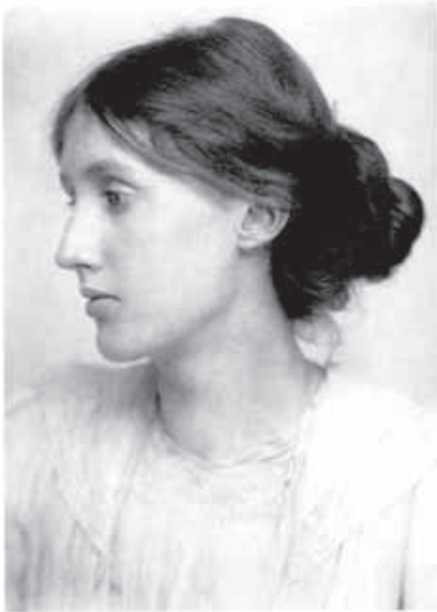
Virginia Woolf (Lontoo 1882 – Sussex 1941), brittiläinen kirjailija ja kriitikko. Woolf oli kriitikko Sir Leslie Stephenin tytär, joka isän kuoleman jälkeen muutti Lontooseen Bloomsburyn ja avioitui kriitikko Leonard Woolfin kanssa. Heidän kodissaan kokoontui Englannin kulttuurielämään näkyvästi vaikuttanut, älyllisesti taiteeseen ja kulttuuriin suhtautuva niin sanottu Bloomsburyn ryhmä.

Bloomsburylle Woolf muutti isänsä kuoleman jälkeen 1904. Hän asui talossa siskonsa Vanessa ja kahden veljensä kanssa. Heidän kodistaan tuli Bloomsburyn ryhmän keskus. Ryhmä muodostui kirjailijoista ja taiteilijoista, jotka suhtautuivat älyllisesti taiteeseen ja kulttuuriin. Woolfin lisäksi ryhmään kuuluivat muun muassa Clive