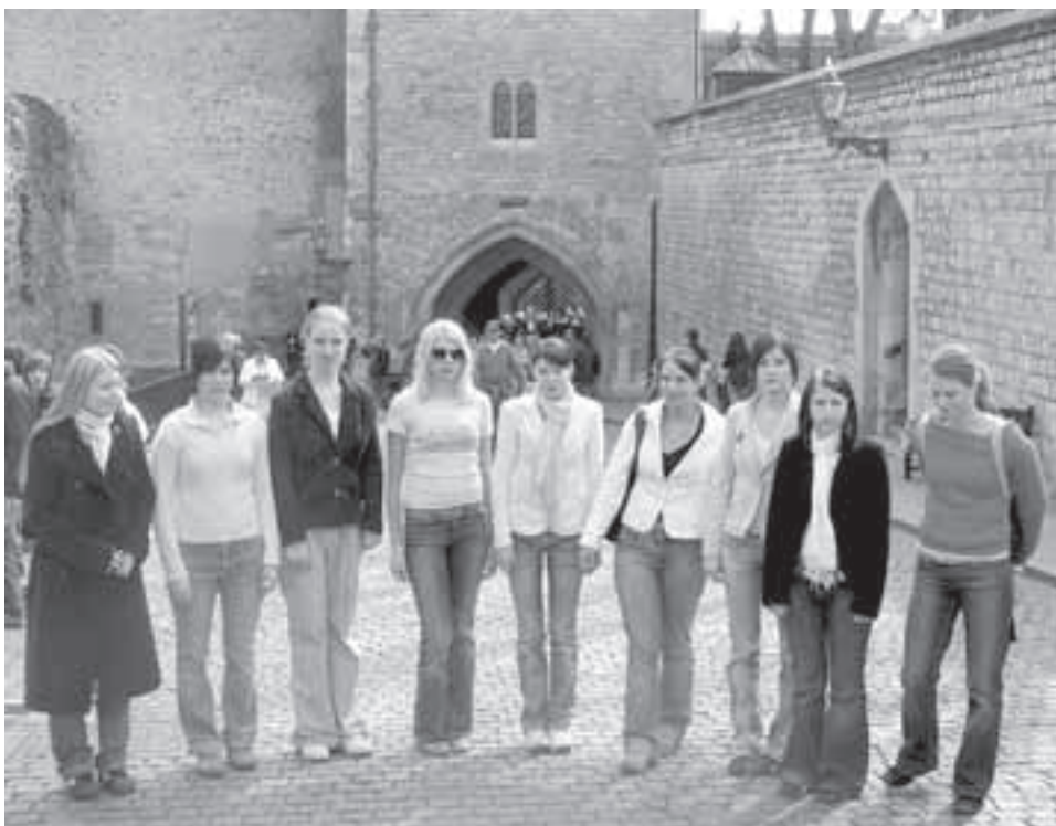
Englannin opintomatkalaiset kokivat Towerin linnoituksella aikamatkan Rikhardin maailmaan. Tower on aareaitta menneeseen maailmaan. 900-vuotisen linnoituksen värikkäisiin vaiheisiin kätkeytyy koko Englannin historia, Wilhelm Valloittajasta Elisabeth ensimmäiseen.