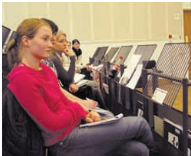
Lukiolaiset saivat haastatella Karita Mattilaa tunnin ajan; sen jälkeen he pääsivät tutustumaan oopperataloon.