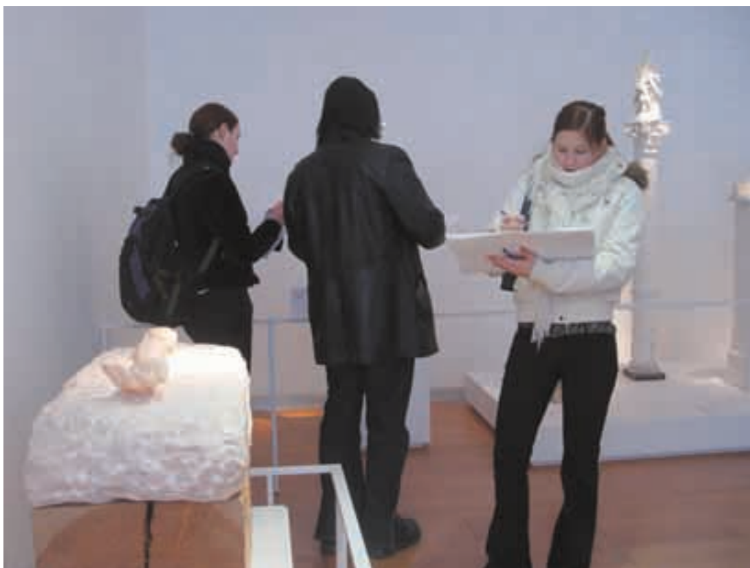
Lukiolaiset luonnostelemassa maalauksiaan Rodin-museossa.

Kärkkäisen mukaan kuvataidekursin tavoitteena on taidehistoriallisesti merkittäviin teoksiin tutustumisen