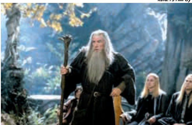
Viisas velho Gandalf.