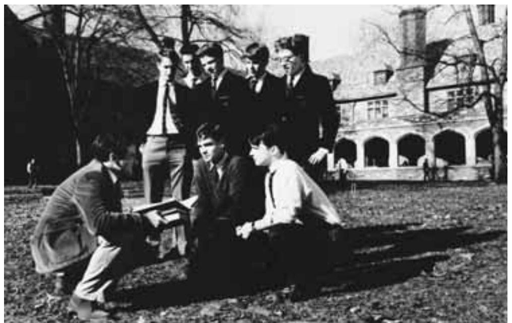
Keatingin vuosikirjaa selaillessaan pojat saavat idean herättää henkiin opettajansa aikaisen "Kuolleiden runoilijoiden seuran", jossa heidän on vain tarkoitus nauttia runoudesta ja elämästä.

Koulun oppilaille Neilin kuolema oli tietenkin valtava järkytys, mutta eniten kuolema kosketti kuitenkin Toddia ja herra Keatingin. Keating oli onnistunut työssään opettajana. Hän oli saanut luotua Toddin ja muihin oppilaisiin itsenäisyyttä, jota oli ajanut alusta asti takaa. Keatingin oli kuitenkin lähdeittävä pois, sillä Neilin kuoleman jälkeen hänet erotettiin. Koulun pojat menettivät hänessä parhaan opettajan, joka heillä ikänä oli ollut. Hänen lähtiessään Toddin johdolla oppilaat kukin vuorollaan nousivat pulpetilleen uhmaten uutta ja ankaraa opettajaa. Keating oli antanut Toddille rohkeutta osoittaa omat mielipiteensä, ja lopulta Todd avautui. Elokuvassa kuvasi näiden poikien henkistä kasvua, joka tapahtui hyvin pienessä ajassa. Varsinkin Toddin henkinen kasvu välittyi katsojille myös kameran ansiosta. Todd oli kuvattu hyvin läheltä ja isona hänen seisossaan pulpetillaan uhmakkaasti ja osoittamassa kunnioitustaan Keatingille. "Oi kapteeni, minun kapteenini!" kantautui Toddin ja muiden entiselle opettajalleen uskollisten oppilaiden suusta Keatingin astuessa luokkahuoneen ovesta uuteen elämään.