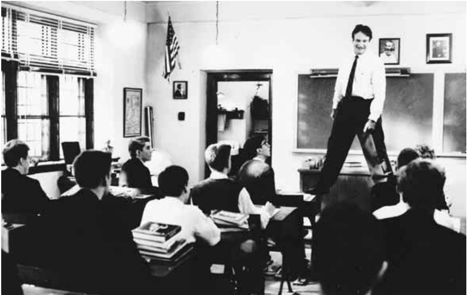
Weltonin sisäoppilaitokseen tulee kirjallisuuden opettajaksi John Keating (Robin Williams), joka aikoinaan on itsekin opiskellut samassa talossa. Uusi opettaja käyttää aivan erilaisia opetusmetodeja kuin muut. Hän haluaa poikien löytävän oman ajattelutapansa ja hyväksyvän voimakkaat tunteet, kuten kauneuden, rakkauden ja romantiikan, jotka itseään etsivillä nuorilla polttavat sydäntä.

Elokuvasa on paljon esillä juuri tämä lentävä lause, ”Carpe Diem”. Se ei kuitenkaan ole elokuvan sanoma, mutta vanha viisaus, jonka voisi palauttaa mieleen useammin. Me ihmishän elämme ajan armoilla. Oikeastaan aika määrittelee koko elämän – mutta siltikään me emme sitä ymmärrä. Mitä on hetki? Ei yhtään sen helpompaa käsitteä kuin aika, mutta toisaalta, elämä koostuu hetkistä. Hetken voi kokea. Hetki luo elämälle arvon.