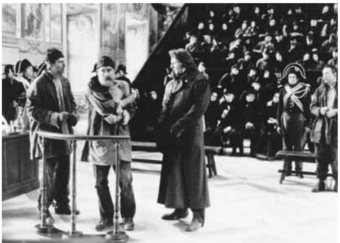
Valjean saapuu oikeudenk  yntiin, jossa syyt  nt   miest   ep  ill  n paenneeksi rangaistusvankiksi; oikea vankikarkuri onkin kaupungin uudeksi pormestariksi noussut Valjean, joka tunnustaa tekonsa.

Ongelmat eiv  t kuitenkaan p  tty t  h  n, s  ll   Mariuksen johtama kansanliike etenee barrikadeille valtiota vastaan. Alueen levotto-