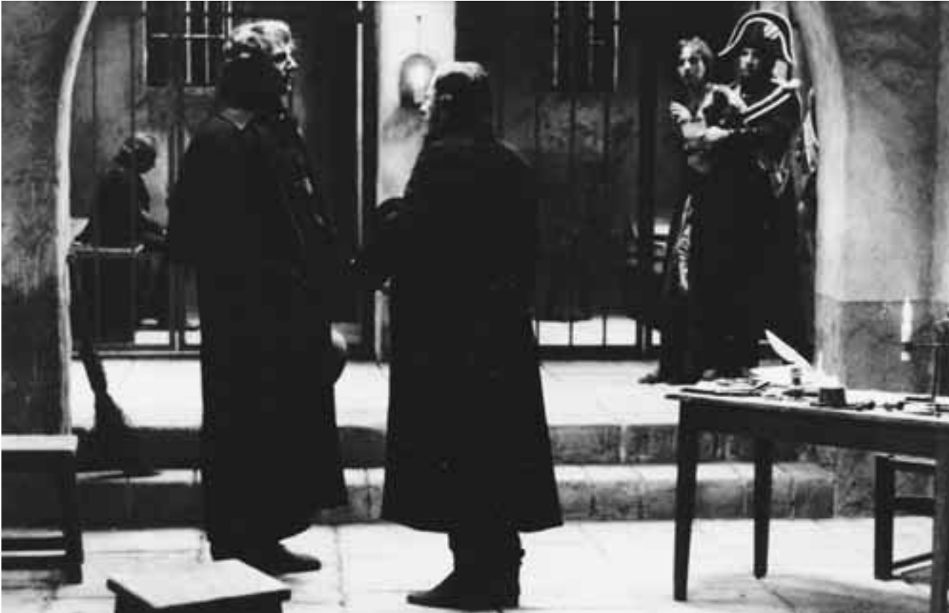
Kaupungin uusi poliisimestari Javert pid  tt   prostituoituksi ajautuneen Fantinen. Pelastajaksi saapuu Valjean, joka palkkaa h  net kotiapulaisekseen.

muus saa Valjeenin ilmoittamaan Cossettelle tulevasta muutosta. Cossette raivostuu, mutta l  htee hyv  stelem  n Mariuksen, jonka Javert on kuitenkin napannut. T  ll   tavalla komissaari yritt   saada Valjeenin kiikkiin. Tilanne ratkeaa kuitenkin Cossetten viisaan toiminnan takia siten, ett   Javert vie d  n tapettavaksi vallankumouksellisten majapaikkaan. Cossette saa Valjeenin ymm  rt  m  n, ettei voi el   ilman Mariusta, ja Valjean uhraa ihailtavasti kasvattityt  rens   onnen vuoksi henkensä, l  htiess  n vallankumouksen r  iskyvien tapahtumien keskelle, tuodakseen Mariuksen mukanaan. Samaisella matkallaan h  n my  s t  rm   tappolaukausta odottavaan Javertiin. Valjean sanoo vartijoille ampuvansa t  m  n itse, mutta p   st   t  m  n menem  n talon ulkopuolella. H  n ei tahtonut vajota niin alas kuin moni muu olisi varmasti tehnyt samassa tilanteessa. Ei h  n vihaa Javertia. Pikemminkin h  n s  ilii t  t  . Valjean s  ilii Javertia sen takia, ettei t  m   k  sit  , ett   ihmiset muuttuvat, ett   kaikilla on oikeus el  m  n, my  s k  yhill  . Mik  n ei kuitenkaan riitt   Javertille, ei edes se, ett   Valjean s  st   t  m  n hengen. Javert nimitt  in tulee pid  tt  m  n Valjeenin ennen kuin t  m   ehtii Cossetten ja Mariuksen kanssa l  hte   pakomatalle.