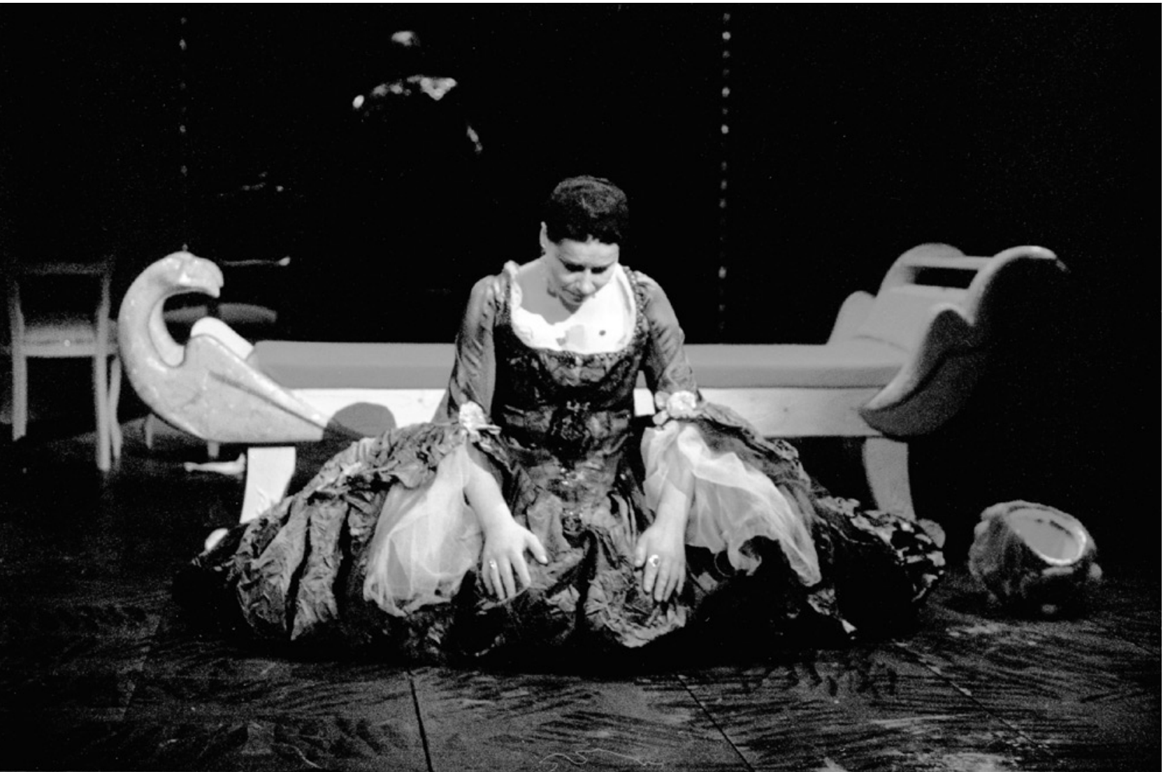
Näytelmän lopussa Céliméne epätoivoissaan ja häpeissään riisuu kotkotustensa symbolin eli korkean peruukin - vähäksi aikaa.

Lavastus kiteytyy viiteen suureen kaappiin, joihin on pantu tapahtumaan mitä erilaisempia asioita. Jossain vaiheessa näytelmää kaapista löytyy jopa elävä sellisti – se oli ehkä kaappioivaluksista paras ja mieleen jäävin. Kaapista pursuavat kirjeet oli myös hyvä juttu. Alun perin kaappeja piti kuulemma olla seitsemän, kuvaamassa seitsemää kuolemansyntiä, mutta näyttämö oli liian pieni tähän tarkoitukseen. Tarinaa on jotenkin vaikea ymmärtää, en olisi tajunnut vähääkään, jos en olisi lukenut käsikirjoitusta aiemmin. En tosin voi sanoa ymmärtäneeni kovin pal-